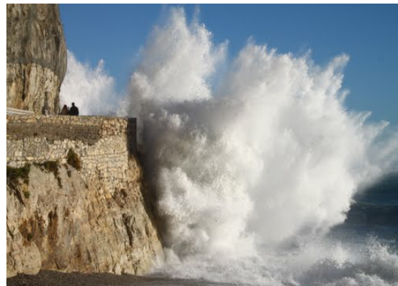
Foto: SS1 Aurelia a Capo Noli e a Finale Ligure