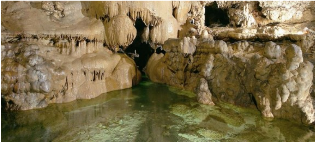
Foto: Le Grotte di Toirano

Terminata la visita alle grotte, Toirano ci regala ancora un' ultima emozione: si imbecca la SP1 in direzione Bardineto, una strada fantastica tutta da guidare con il vento nei capelli, che con panorami mozzafiato ci porterà rapidamente agli 801m s.l.m del Gioigo di Toirano, un valico delle Alpi Liguri fra il bacino padano ricco di faggete ed il bacino del mar ligure, più caldo e arido.