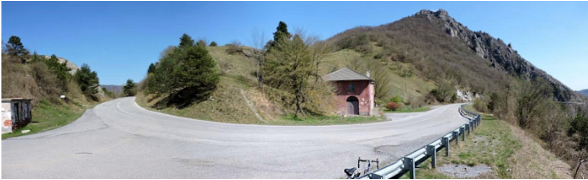
Foto: Il Colle Scravaion, la vecchia Casa Cantoniera e la vetta della Rocca Barbena