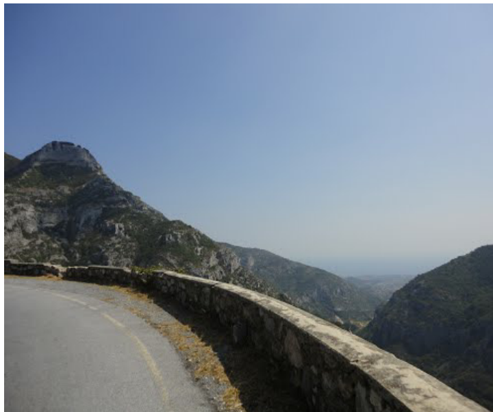
Foto: La SP1

Terminata la visita alle grotte, Toirano ci regala ancora un' ultima emozione: si imbecca la SP1 in direzione Bardineto, una strada fantastica tutta da guidare con il vento nei capelli, che con panorami mozzafiato ci porterà rapidamente agli 801m s.l.m del Gioigo di Toirano, un valico delle Alpi Liguri fra il bacino padano ricco di faggete ed il bacino del mar ligure, più caldo e arido.